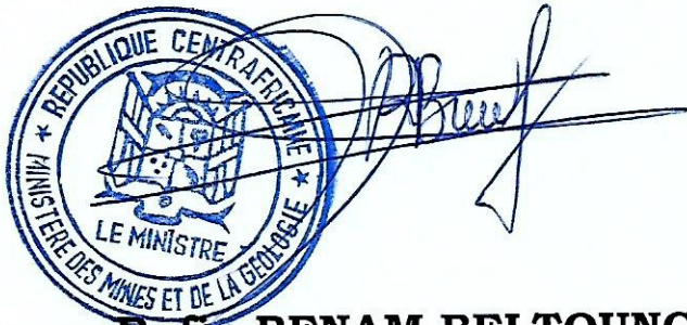
Rufin BENAM BELTOUNGOU

Le Premier Ministre, Chef du Gouvernement