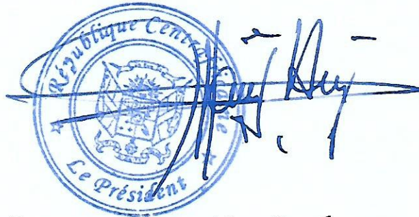
Professeur Faustin Archange TOUADERA

Le Président de la République, Chef de l'Etat